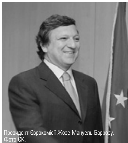
Президент Єврокомісії Жозе Мануель Баррозу.

Єврокомісія прагне посилити роль ЄС як глобального лідера, не змінюючи установчі документи об'єднання. 8 червня Комісія оприлюд