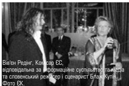
Вів'єн Редінг, Комісар ЄС, відповідальна за інформаційне суспільство та медіа та словенський режисер і сценарист Блаж Кутін.

На Канському кінофестивалі відбувся традиційний День Європи. 22 травня словенський режисер і сценарист Блаж Кутін одержав нагороду "Новий талант Європи" із рук Комісара з інформаційного суспільства та медіа Вів'єн Редін'.