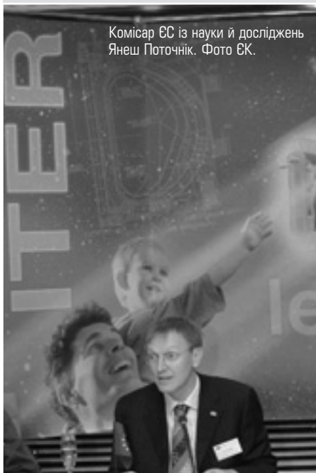
Комісар ЄС із науки й досліджень Янеш Поточнік.

Він стане найбільшим у світі проектом із наукової співпраці, об'єднавши зусилля країн, що разом складають половину населення планети. Цей проект спрямовано на