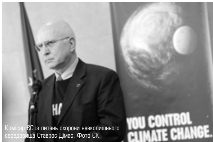
Комісар ЄС із питань охорони навколишнього середовища Ставрос Дімас.

ЄС займає провідні позиції у заходах, спрямованих на збереження екологічної рівноваги та, переконує США та інші країни-«забруднювачі» скоротити рівень шкідливих газів.