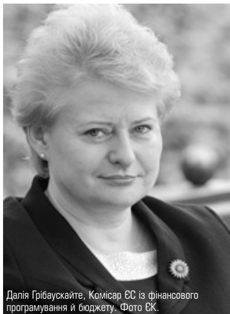
Далія Грібаускайте, Комісар ЄС із фінансового програмування й бюджету.

Б ільшість коштів ЄС у 2007 — 2013 роках буде спрямовано на модернізацію та економічне зростання. 24 травня Європейська Комісія оприлюднила попередню версію своїх пріоритетів щодо фінансових програм у новому європейському бюджеті. "Це серйозний крок уперед, який закладає підвалини для запровадження нових програм з 2007 року. Ми збираємося якомога швидше завершити цей процес", — каже Президент Єврокомісії Жозе Мануель Баррозу.