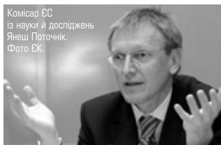
Комісар ЄС із науки й досліджень Янеш Поточнік.

ЄС та США продовжують спільну роботу над біотехнологічними дослідженнями. З нагоди свого візиту до Америки, Комісар ЄС із науки та досліджень Янеш Поточнік підписав угоду про продовження роботи Оперативної групи зі співпраці в галузі біотехнологічних досліджень.