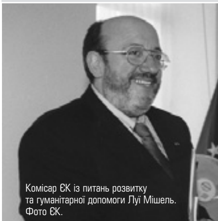
Комісар ЄК із питань розвитку та гуманітарної допомоги Луї Мішель.

Європейська Комісія надала €5 млн. для допомоги жертвам конфлікту в Непалі та біженцям із Бутану, які перебувають у цій країні. Виділені кошти допоможуть забезпечити постраждалих у результаті цього давнього конфлікту питною водою, засобами санітарії, продуктами харчування. Усі кошти спрямовуються через ЕСНО — Генеральну Дирекцію з гуманітарної допомоги ЄК, відповідальний — комісар ЄК Луї Мішель. Комісія — один із головних донорів гуманітарної допомоги в Непалі.