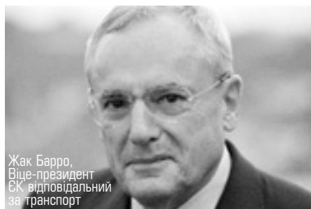
Жак Барро, Віце-президент ЄК відповідальний за транспорт

У Брюсселі 9 червня міністри з Німеччини, Австрії, Словаччини і Франції підписали заяву про намір якнайшвидше завершити будівництво швидкісної залізничної лінії Париж-Страсбург-Штутгарт-Відень-Братислава.