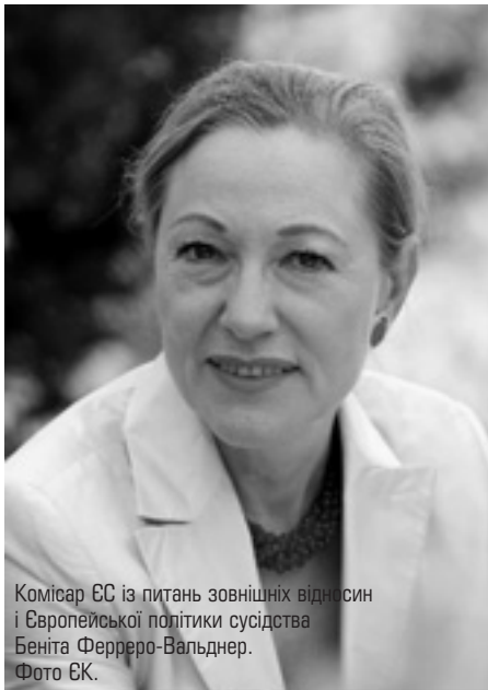
Комісар ЄС із питань зовнішніх відносин і Європейської політики сусідства Беніта Ферреро-Вальднер.