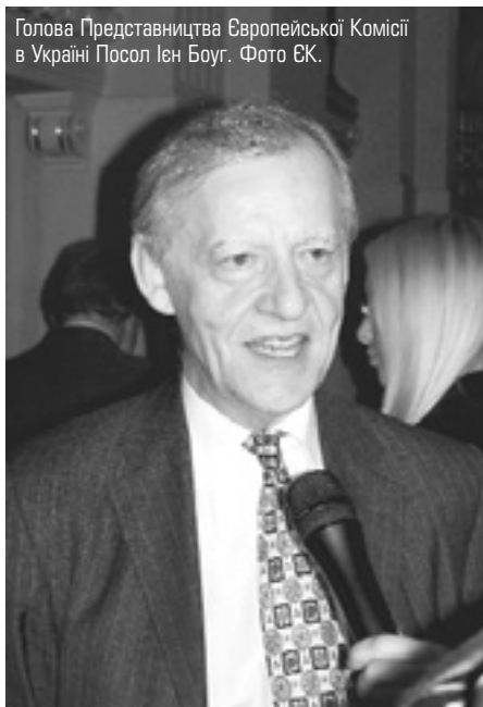
Голова Представництва Європейської Комісії в Україні Посол Ієн Боуг.

його словами, цей проект працює у кількох інших регіонах України. ■