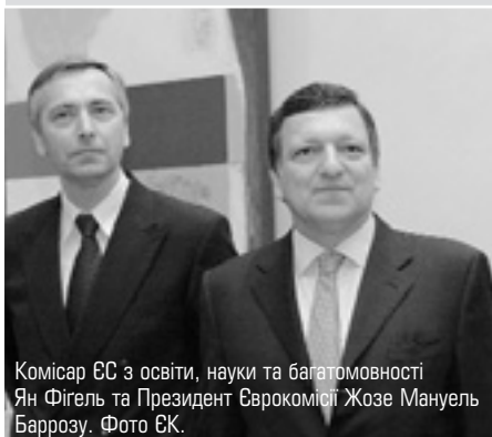
Комісар ЄС з освіти, науки та багатомовності Ян Фігель та Президент Єврокомісії Жозе Мануель Баррозу.

8 червня Європейська Комісія оприлюднила подробиці свого плану зі створення Європейського технологічного інституту. Ще в березні весняні збори Європейської Ради закликали Комісію деталізувати свою пропозицію зі створення цього закладу освіти.