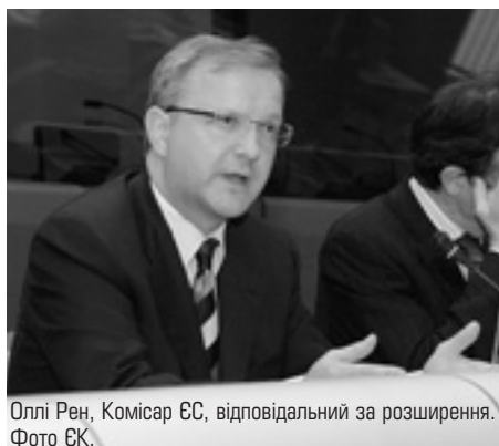
Оллі Рен, Комісар ЄС, відповідальний за розширення.

Позиція української сторони під час засідання Постійної Ради була підтримана делегаціями Європейського Союзу і США. ■