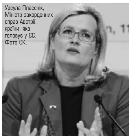
Урсула Пласнік, Міністр закордонних справ Австрії, країни, яка головує у ЄС.

Урсула Пласнік, Міністр закордонних справ Австрії, країни, яка зараз головує у Євросоюзі, заявила, що Австрія домагатиметься негайного закриття в'язниці. Депутати Європарламенту рішуче підтримали резолюцію, яка закликає США закрити Ґуантанамо.