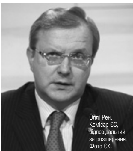
Оллі Рен, Комісар ЄС, відповідальний за розширення.

Разом із тим, пан Рен вважає, що взяті на себе зобов'язання треба поважати. За його словами, не йдеться про відмову від розширення взагалі. "Я не бачу справжньої потреби в якихось "третіх шляхах" у межах нових багатосторонніх структур. Навпаки, я схилився до посилення Європейської політики сусідства,