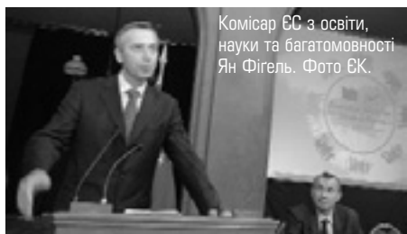
Комісар ЄС з освіти, науки та багатомовності Ян Фігель.

Понад 1300 студентів і 230 викладачів з 92 країн візьмуть участь у магістерській програмі «Erasmus Mundus» у 2006 – 2007 роках.