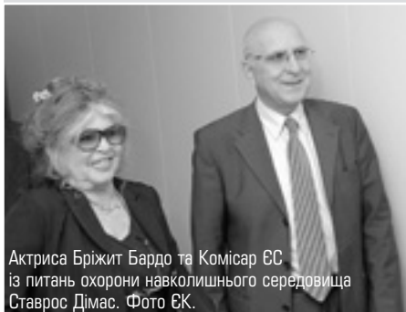
Актриса Бріжит Бардо та Комісар ЄС із питань охорони навколишнього середовища Ставрос Дімас.

9 червня комісар ЄК Ставрос Дімас зустрівся з видатною актрисою минулого, людиною-легендою Бріжит Бардо. Багато років тому вона організувала Фонд, який носить її ім'я. Фонд Бріжит Бардо займається захистом домашніх та диких тварин у усьому світі. Сьогодні Фонд спонсорують понад 57 000 осіб з 60 країн світу, тут працює 323 інспектори. Штаб-квартира Фонду з 30 співробітниками знаходиться в Парижі. Робота Фонду спрямована на допомогу притулкам, порятунків тварин, проведення кампаній з їх стерилізації та інше.