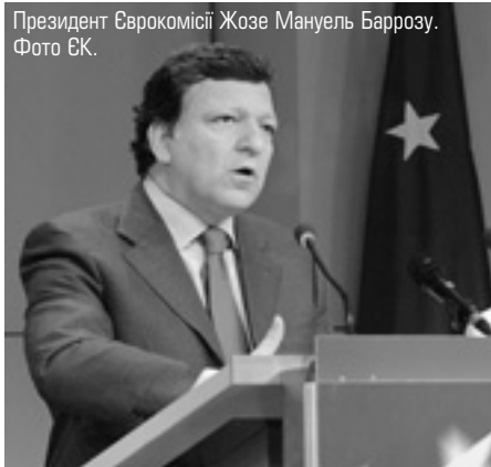
Президент Єврокомісії Жозе Мануель Баррозу.

За активної участі ЄС уже вдалося зробити основні ліки проти цієї недуги доступнішими для населення країн "третього світу". У рамках СОТ розвивається співпраця з найбільшійми країнами, їм надають допомогу та кре-