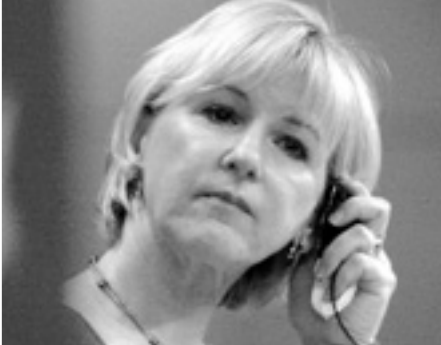
Комісар ЄС з інституційних відносин та комунікативної стратегії Марго Вальстрьом.

ду, скорочення кількості Комісарів та запровадження єдиного міністра закордонних справ ЄС).