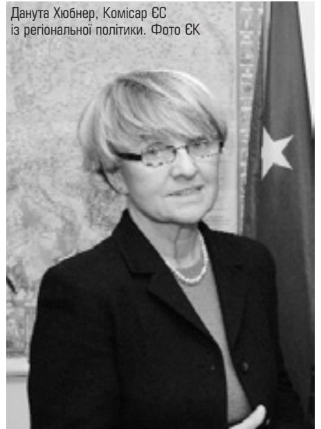
Данута Хюбнер, Комісар ЄС із регіональної політики.

Підписання відбулося у присутності Президента Єврокомісії Жозе Мануеля Баррозу. Ідею ініціатив було презентовано ще в жовтні минулого року на зустрічі міністрів країн ЄС і на конференції Єврокомісії у листопаді. ■